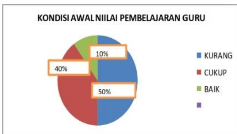
Gambar 2. Hasil Kondisi Awal

Melihat fakta di atas, peneliti sebagai kepala sekolah merasa perlu untuk melaksanakan suatu upaya untuk meningkatkan nilai pembelajaran guru di SD Negeri Sembungharjo 02 Semester I Tahun Pelajaran 2021/2022 dengan menerapkan supervisi akademik. Dengan mengamati hasil kondisi awal masih sangat kurang dengan nilai rata-rata 59,4 maka peneliti perlu melakukan tindakan selanjutnya, yaitu melakukan tindakan siklus 1. Siklus 1 terdiri atas beberapa tahap, yaitu: Perencanaan, Pelaksanaan, Pengamatan dan Evaluasi, dan Refleksi.